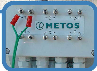
Metos weather data